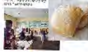
ホノカアで味わえる和食