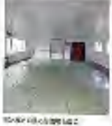
ホノカアの街並み