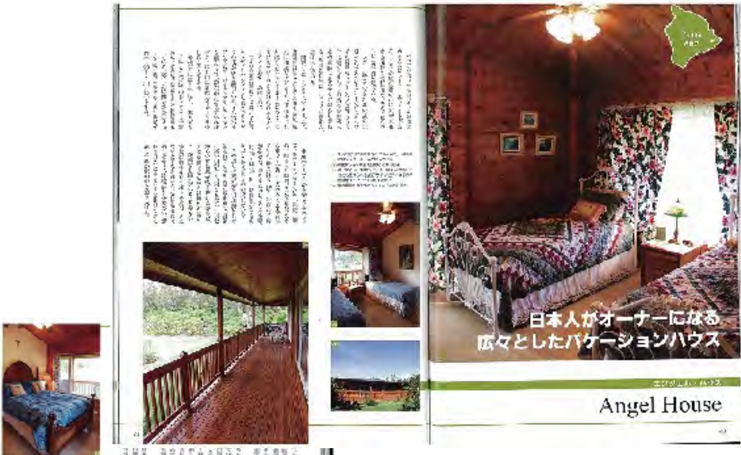
日本人がオーナーになる 広々としたパッケージハウス

エンジェルハウスの近くの溶岩の観測スポット、塩水温泉、「ホノカアボーイ」(今春、映画化)の舞台になったホノカアも紹介されています。