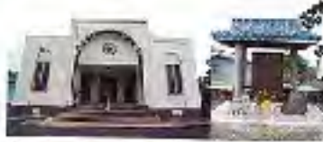
ホノカアの歴史を刻む建物の一つ

1900年代前半に、日系移民がハワイに定住し、この街を築き上げた。その歴史が刻まれた街、ホノカア。