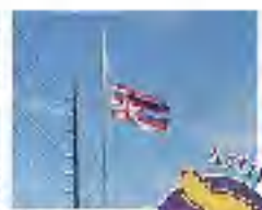
ホノカアの街並み