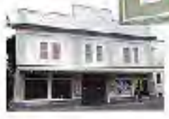
ホノカアの街並み

ホノカアの歴史を学ぶには、この街を歩くことが一番の近道である。また、ホノカアには、多くの日系移民の文化が息づいている。また、ホノカアには、美しい自然環境もあり、観光客に人気がある。ホノカアの歴史を学ぶには、この街を歩くことが一番の近道である。