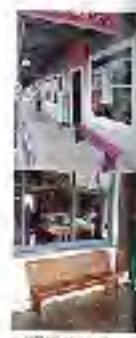
ホノカアの街並み

ホノカアは、1900年代前半に、日系移民がハワイに定住し、この街を築き上げた。その歴史が刻まれた街、ホノカア。この街には、多くの歴史的な建物や、日系移民の文化が息づいている。また、ホノカアには、美しい自然環境もあり、観光客に人気がある。ホノカアの歴史を学ぶには、この街を歩くことが一番の近道である。また、ホノカアには、多くの日系移民の文化が息づいている。また、ホノカアには、美しい自然環境もあり、観光客に人気がある。ホノカアの歴史を学ぶには、この街を歩くことが一番の近道である。