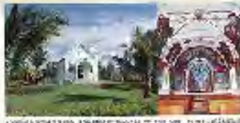
ホノカアの歴史を刻む建物の一つ